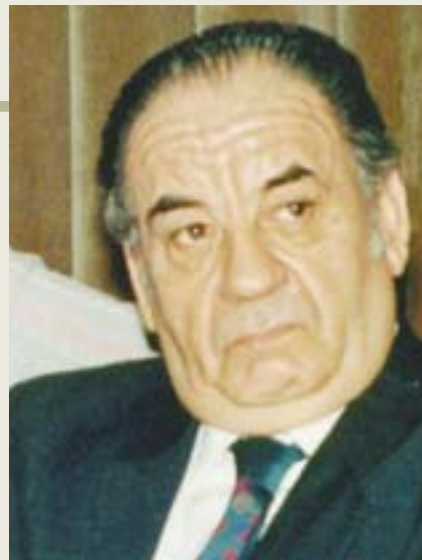
"Anécdotas y Recuerdos del Deporte Tucumano".

Como todo hombre, tuvo un pequeño defecto: era hinchado de Racing. Fanático de la música y en especial del tango, muchas noches deleitó a sus colegas con su voz, y fue tal su motivación que escribió un libro: "Pido Permiso Señores", que fue precedido por dos creaciones literarias que demostraron su vocación de escritor y que dedicó a su pueblo natal - "Simoca, mi pueblo"- y a su padre, un famoso deportista tucumano y que tituló